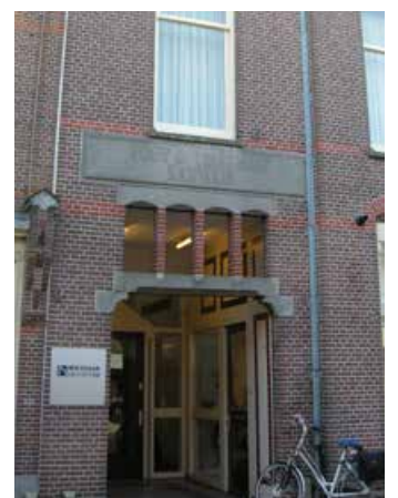
Prins Hendrikstraat 16

Deze wandeling is tot stand gekomen in samenwerking met Stichting Historische Kring Bodegraven en is mede mogelijk gemaakt door gemeente Bodegraven-Reeuwijk.