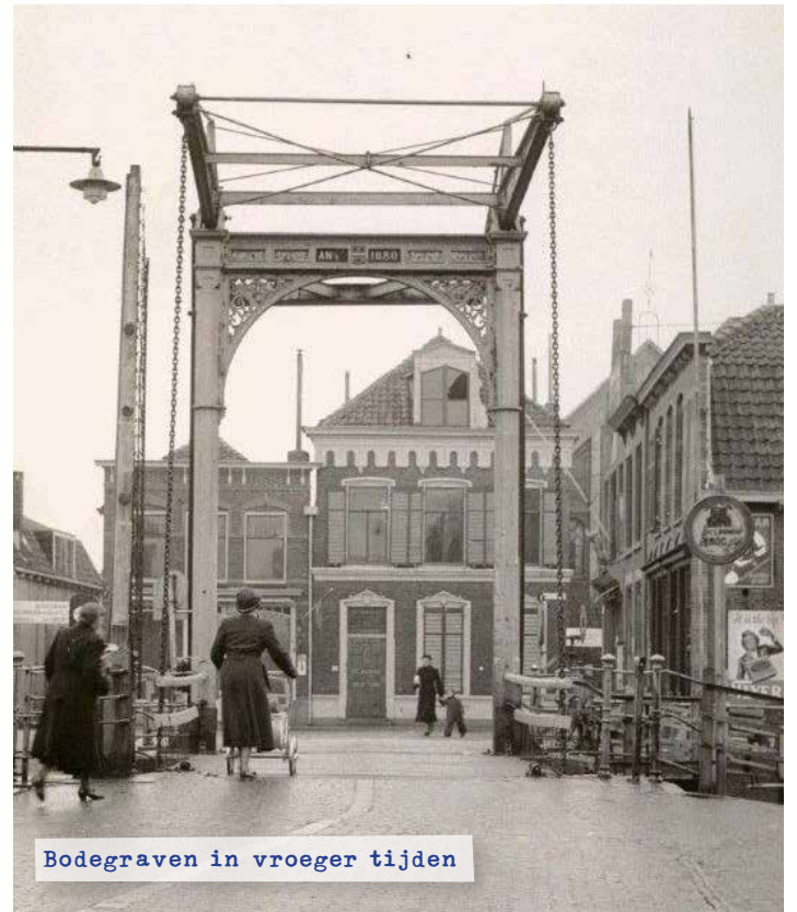
Bodegraven in vroeger tijden

Aan het einde van de straat zien we het gerestaureerde 'Bij Everts'. Waar nu het culturele hart van de gemeente klopt, was in vroeger tijden Zaadhandel Turkenburg gevestigd. Wie meer over de kaashistorie wil weten, bezoekt op de derde etage het Kaasmuseum. De wandeling gaat verder rechtsaf de Spoorstraat in. Aan het einde links de Spoorlaan op en dan de tweede weer links. We zijn nu op de Achter Nieuwstraat.